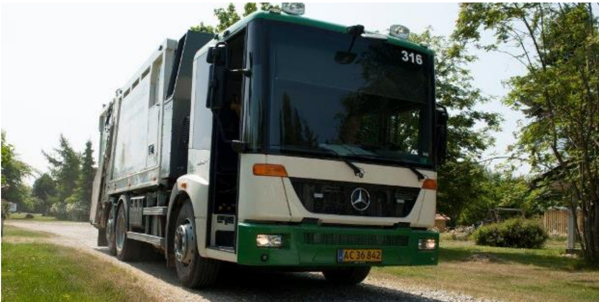
Skraldebiler må gerne køre over Kronprins Frederiks Bro.