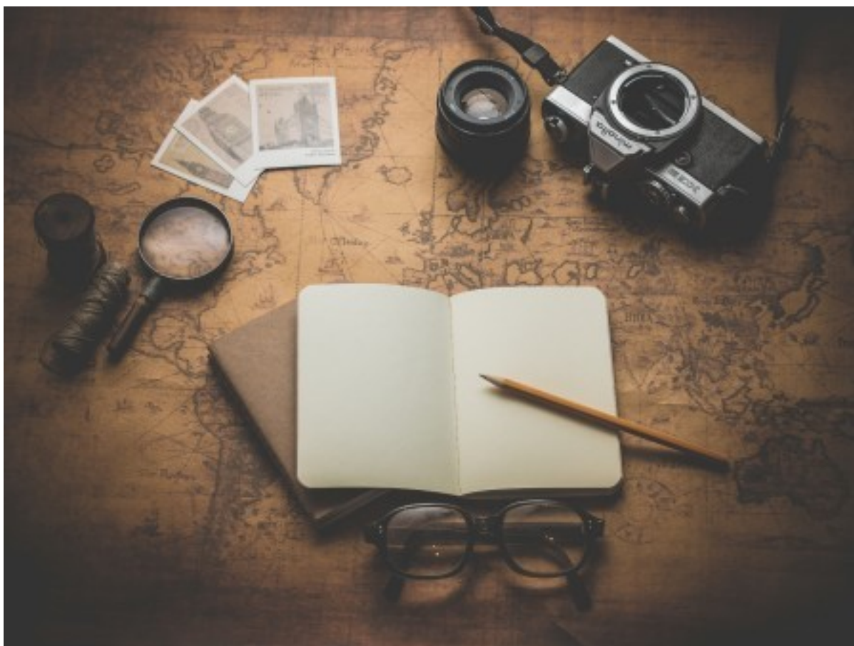
Løs en mordgåde på Færggården.

Det er snart vinterferie og det ser både børn og voksne sikkert frem til. Men hvad skal man så lave i ferien? Det er der masser af gode bud på fra forskellige institutioner i Frederikssund Kommune.