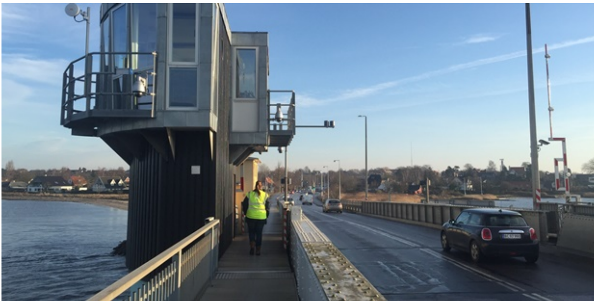
Brotårnet på Kronprins Frederiks Bro.

Vejdirektoratet oplyser, at de fra den 27. januar og året ud tester et nyt system til fjernstyring af Kronprins Frederiks Bro.