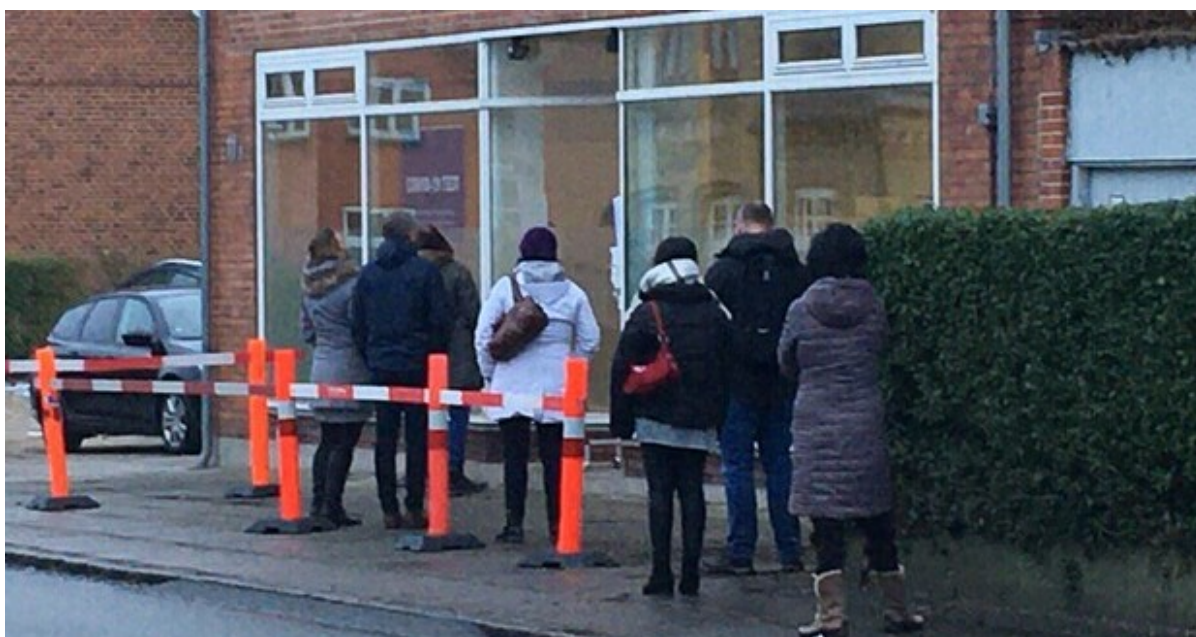
Testcenteret på Lundevej 11 i Frederikssund.

Region Hovedstadens testcenter på Lundevej 11 i Frederikssund øger nu åbningstiden fra 6 til 12 timer fire dage om ugen. Der skal stadig bestilles tid til test, inden man møder frem.