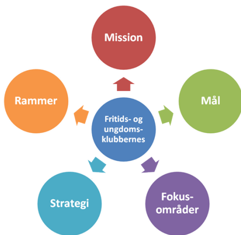
Model over delementerne i mål og rammebeskrivelsen for fritids- og ungdomsklubberne i Frederikssund Kommune

Herudover er klubberne organiseret ud fra fælles mission, mål, fokusområder, rammer og strategi: