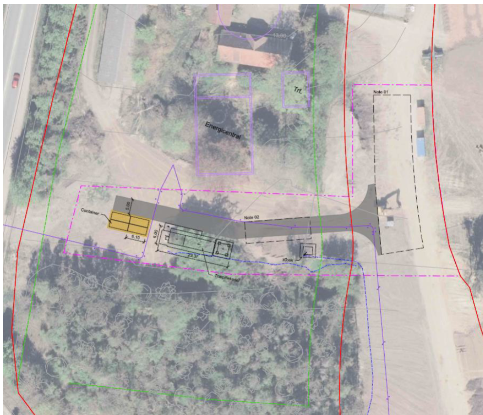
Figur 1 Situationsplan af projekt, der omfatter midlertidig varmecentral og permanent kiosk