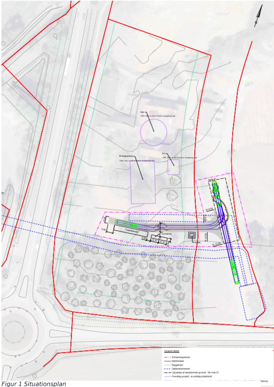
Figur 1 Situationsplan