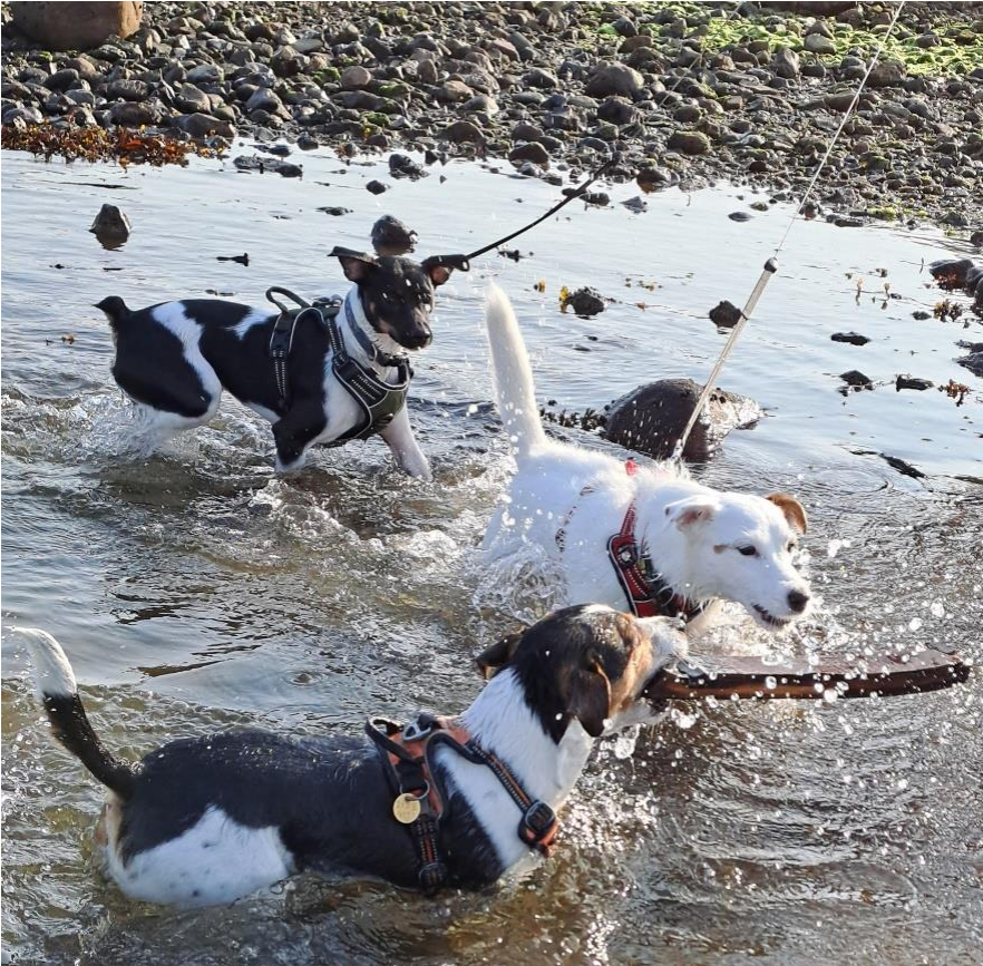
Figur 3. Hundefrikvarter i sommervarmen