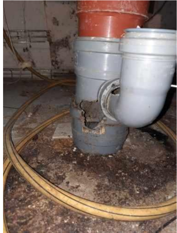
Figur 4. Kloakrør i kælder

Kloakrør i kælder under parcelhus. Rotter har gnavet hul i røret inde fra og er kommet ud i kælderen.