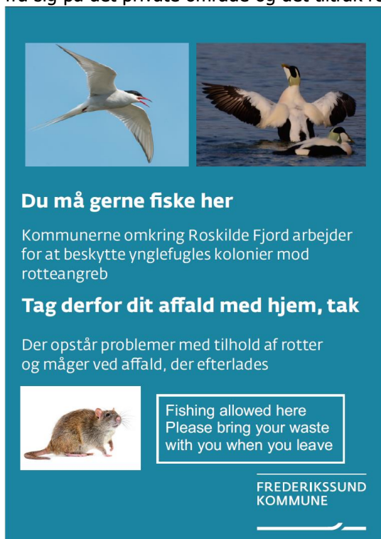
Figur 2. Skilt opsat ved Skovbroen.

Ved anløbsbroen – Skovbroen ved Østskoven – har vi opsat et skilt om rotter og affald. Folk smed fiskeaffald fra sig på det private område og det tiltrak rotter.