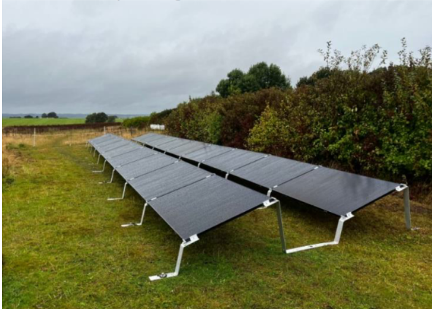
Figur 2 Solcelleanlægget kommer til at se ud som på billedet