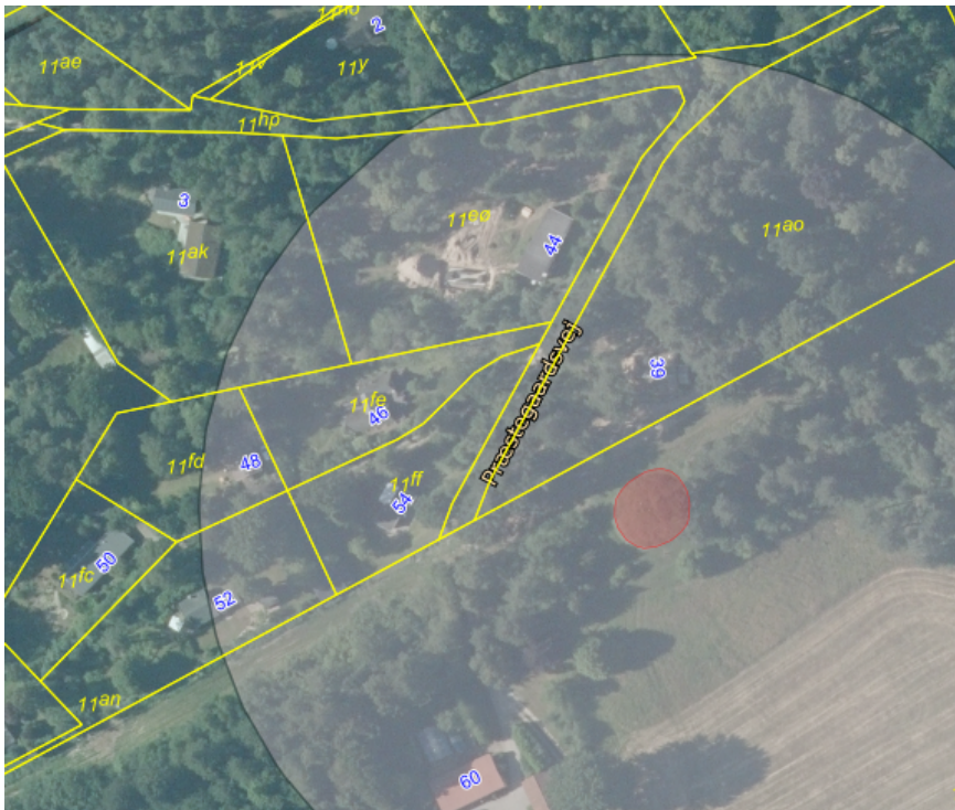
Fredet gravhøj, fredn.nr. 282621 med omgivende fortidsmindebeskyttelseslinje.

Det ansøgte sommerhus vil ligge ca. 70 m nord for en fredet gravhøj, Storehøj med frednings nr. 282621. Gravhøjen er ca. 3,5 m høj og 12,5 m i diameter. Gravhøjen er omgivet af en 100 m fortidsmindebeskyttelseslinje, der rækker ind over det meste af Præstegårdsvej 44.