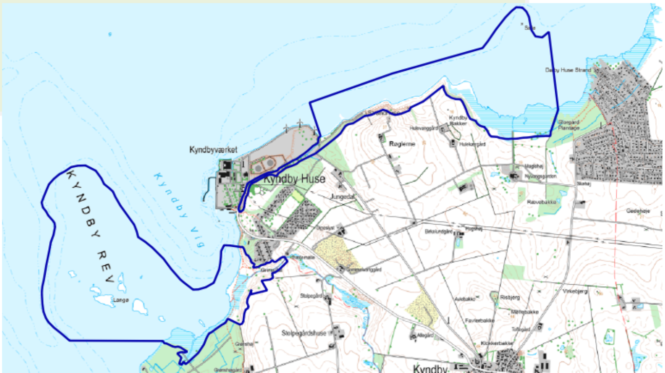
Figur 1: Natura 2000-område nr. 244, Kyndby Kyst (blå afgrænsning).

Indsatsen vil i videst muligt omfang gennemføres ved frivillige aftaler med lodsejere i området. Der findes blandt andet en række tilskudsordninger, som kan søges gennem Landbrugs- og Fiskeristyrelsen.