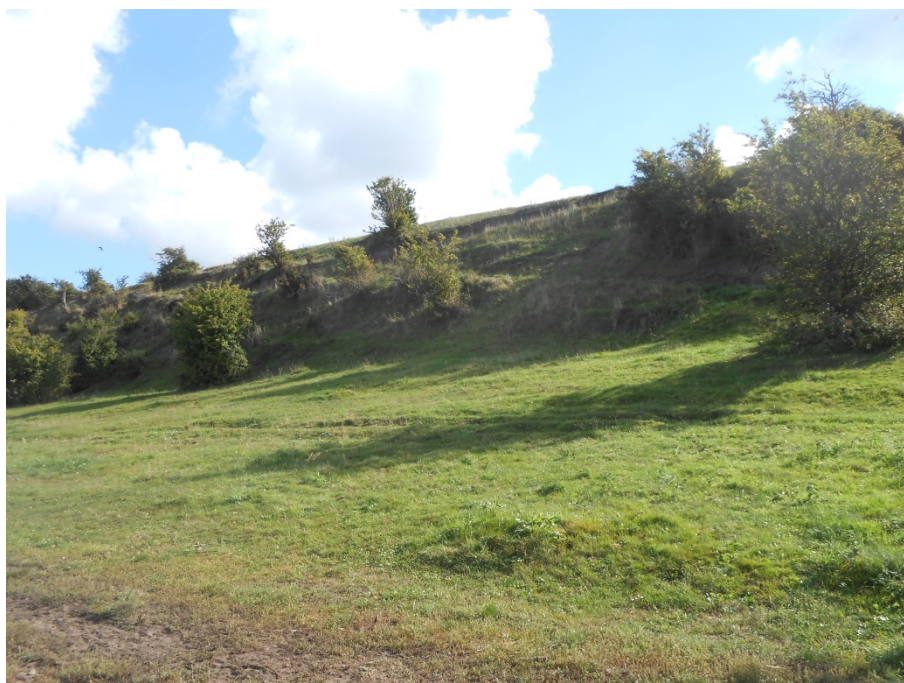
Figur 4: Overdrev ved Kyndby Kyst.