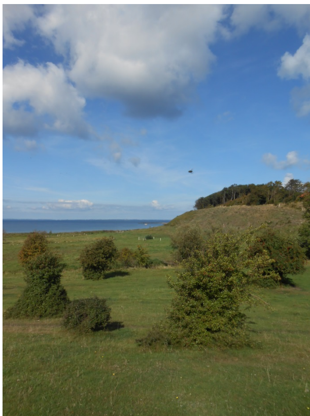
Figur 2: Overdrev. Kyndby Kyst.

For samtlige statslige Natura 2000-planer er der foretaget en strategisk miljøvurdering. Handleplanerne har et indhold, der ikke adskiller sig fra de oplysninger, som allerede er givet i de miljøvurderede Natura 2000-planer. Da handleplanen ikke sætter nye rammer for fremtidige anlægstilladelser eller yderligere vil kunne påvirke internationalt udpegede naturbeskyttelsesområder væsentligt, er det kommunens vurdering, at der ikke er behov for en fornyet miljøvurdering.