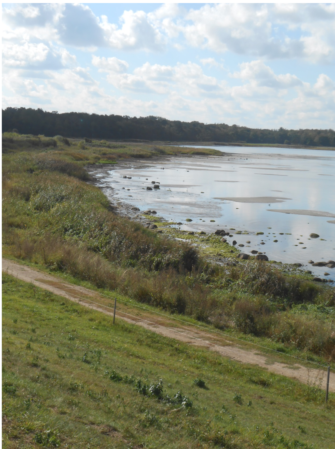
Figur 3: Kyndby Kyst.

Det vurderes, at der ikke er behov for en nærmere fordeling af indsatserne for de enkelte retningslinjer i Natura 2000-planens indsatsprogram (bilag 1), da Frederikssund Kommune er eneste aktør i området.