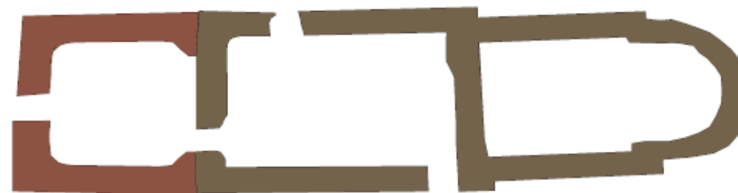
10 m Grundplan over klosterkirken

Klostresamfundet var viet til Sct. Thomas og tilknyttet augustinerordenen. Munkene på Eskilsø var tillige præster og kunne dermed virke som præster og sjælesørgere ved siden af klostergerningen. Dette havde betydning for kirken i en tid hvor der endnu kun var få præster til den voksende menighed.