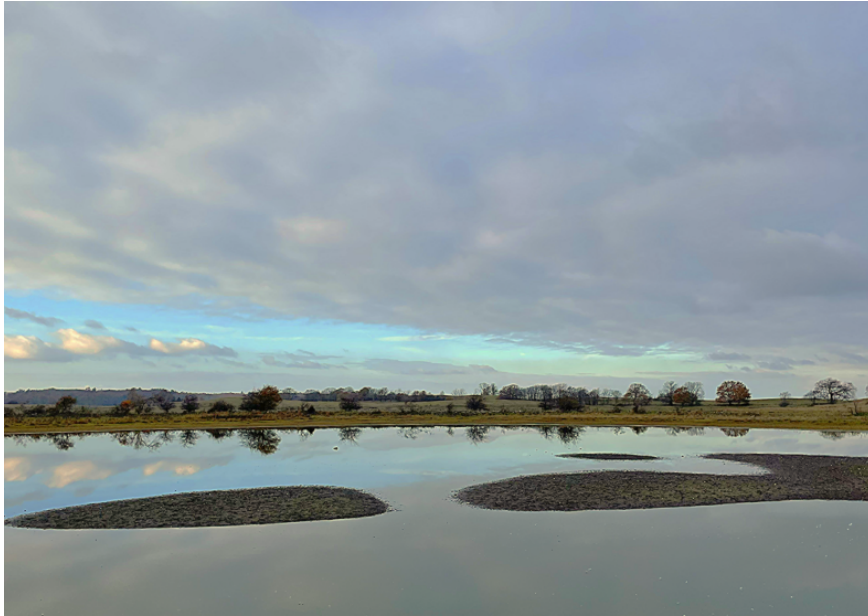
Figur 2 Billedet er taget fra toppen af kystdiget ind over Store Rørmose. I baggrunden nordvest for søen anes det beskyttede dige.