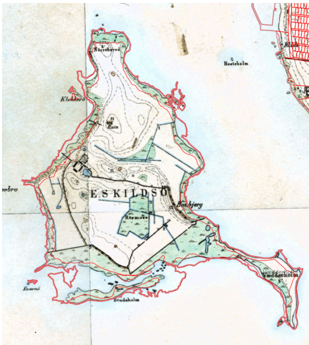
Figur 4 Høje målebordsblad 1842-1899

107 meter sydøst for det beskyttede stendige ligger et kystbeskyttelsesdige, der skal gennembrydes. Der findes ingen historiske data for, hvornår kystdiget er blevet etableret, men det er formentligt sket i midten af 1850'erne. Det optræder på de høje målebordsblade fra 1842-1899.