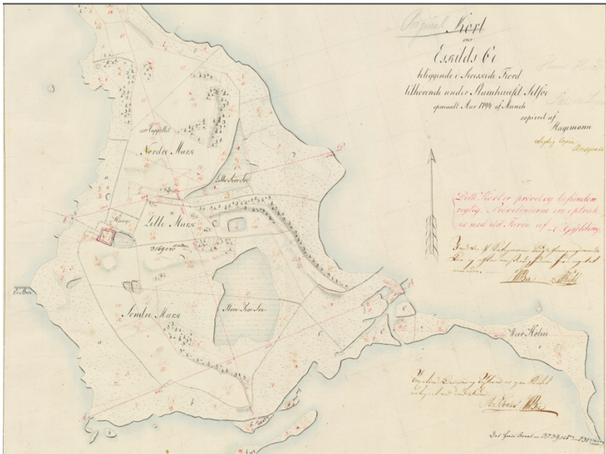
Figur 3 Kort fra 1794

107 meter sydøst for det beskyttede stendige ligger et kystbeskyttelsesdige, der skal gennembrydes. Der findes ingen historiske data for, hvornår kystdiget er blevet etableret, men det er formentligt sket i midten af 1850'erne. Det optræder på de høje målebordsblade fra 1842-1899.