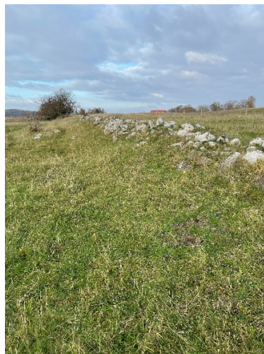
Figur 1 Stendige - billedet er taget fra to andre lokationer på Eskilse. Stendigerne er dog en del af diget, der omkranser Søndre Mark