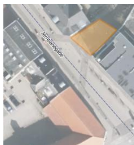
Den lille plads