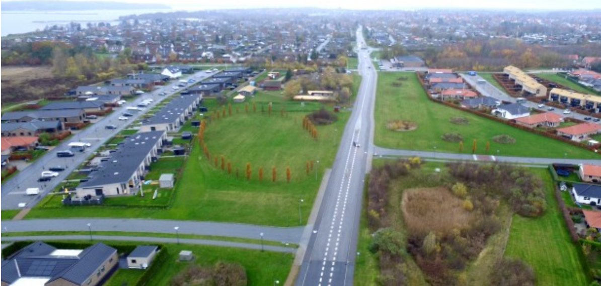
Marbækvej set fra syd mod nord. I forgrunden ses Ørnestens Vænge og Gyldenstens Vænge.