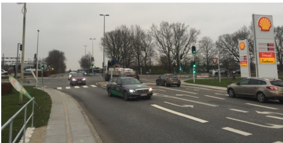
Lyskrydset Askelundsvej/J.F. Willumsens Vej.

Vejdirektoratets entreprenører har arbejdet på at forbedre forholdene for cyklister i tre lyskryds langs J. F. Willumsens Vej i Frederikssund. Det arbejde er nu gennemført, så det fremover bliver nemmere og mere sikkert at krydse vejen for de bløde trafikanter i Frederikssund.