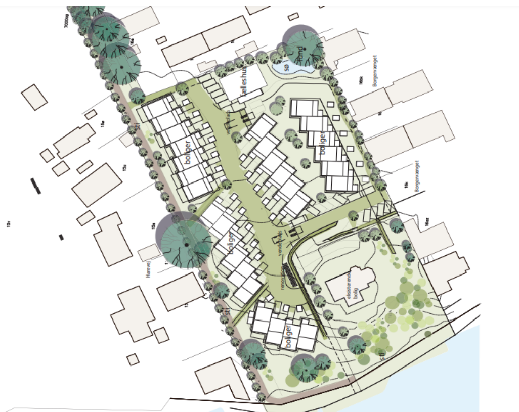
Den oprindelige skitse over planlagt bebyggelse ved Færgevej/Borgervænget. fra høringen af lokalplanen i foråret

Frederikssund Kommune inviterer nu interesserede til et digitalt dialogmøde den 14. december om lokalplanforslag 133 for boliger ved Borgervænget/Færgevej i Frederikssund.