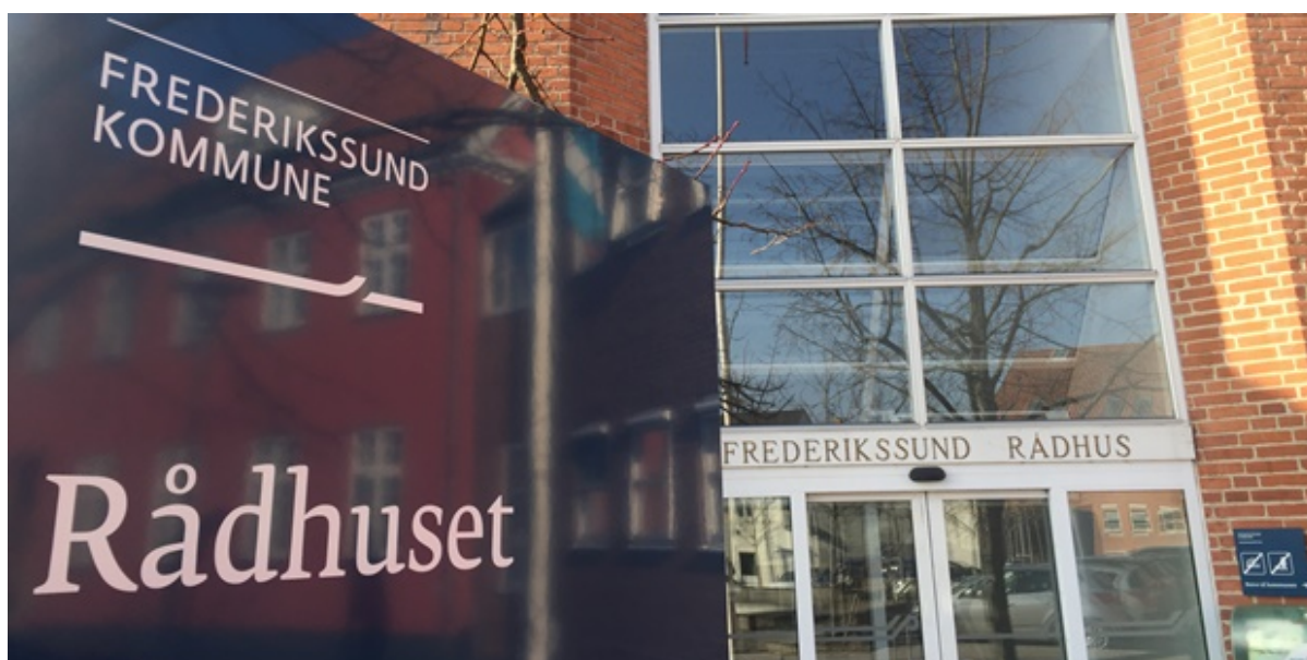
Hovedindgangen på Frederikssund Rådhus.

På baggrund af udviklingsprojektet "Sammen om Frederikssund" er der sket en række organisatoriske justeringer i Frederikssund Kommune. Med besættelsen af fem chefstillinger er den nye chefgruppe nu på plads.