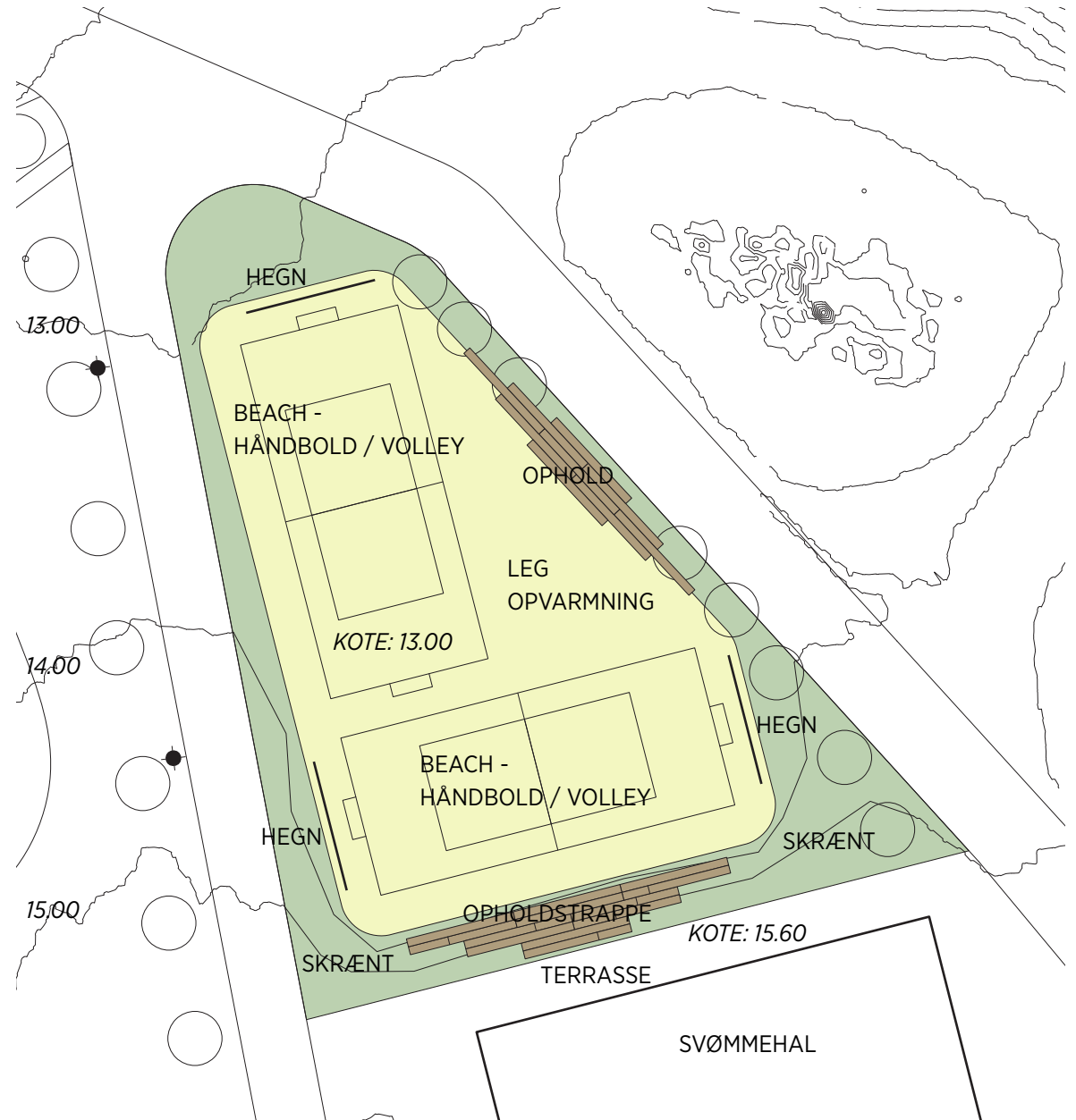
Kort over Beachområde. Mål 1:500