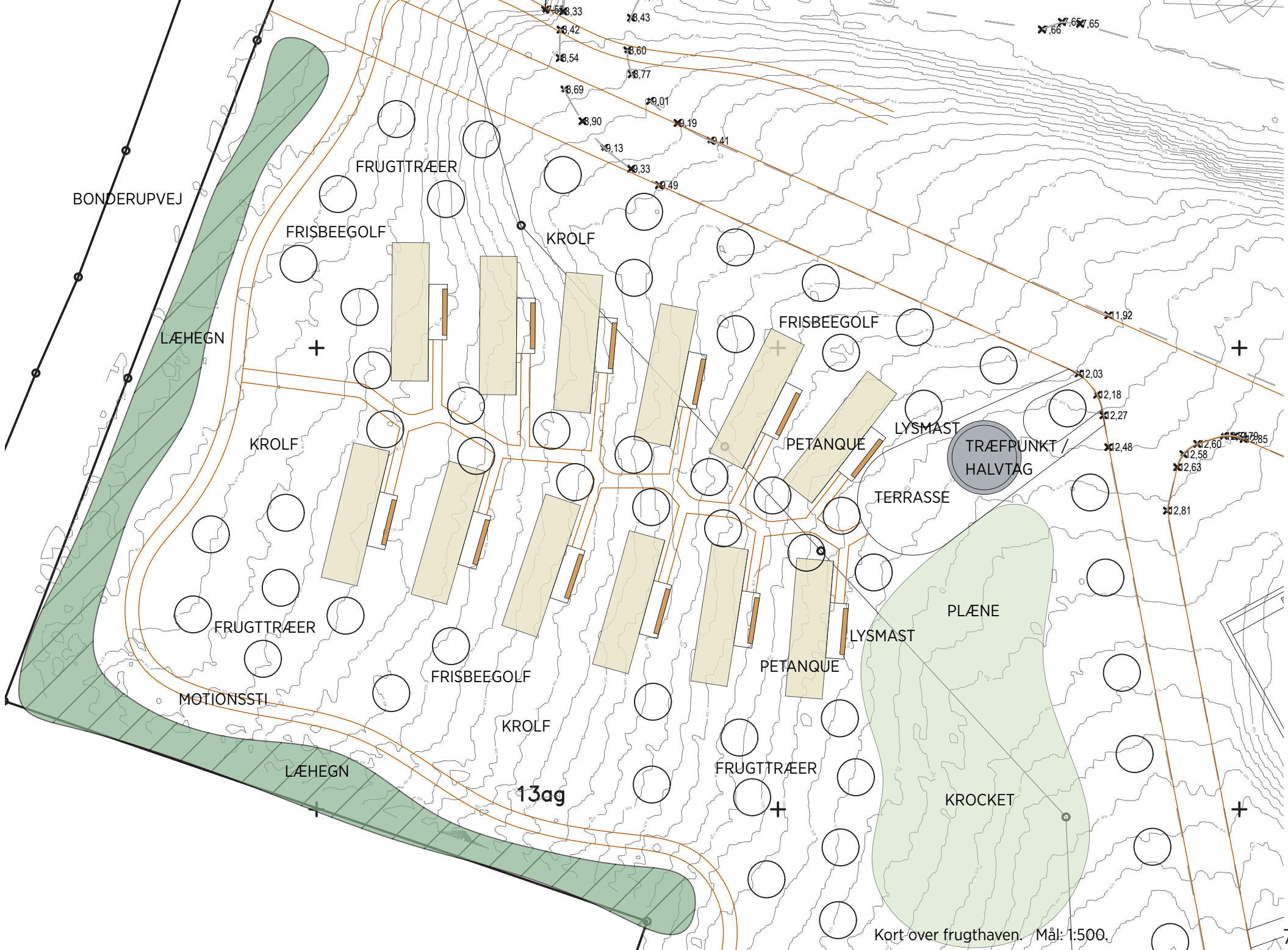
Kort over frugthaven. Mål: 1:500.