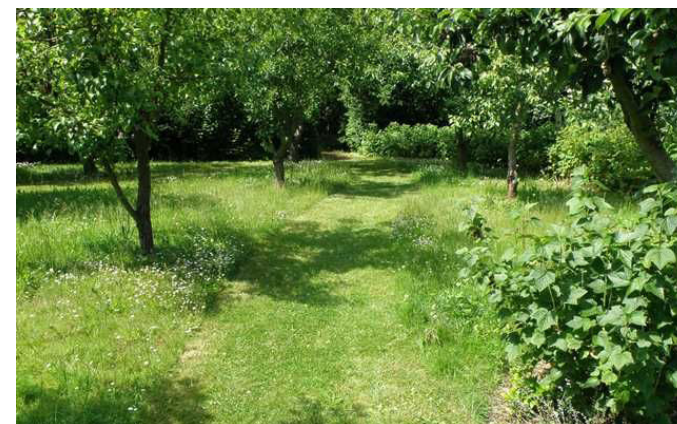
Frugthave med slåede stier