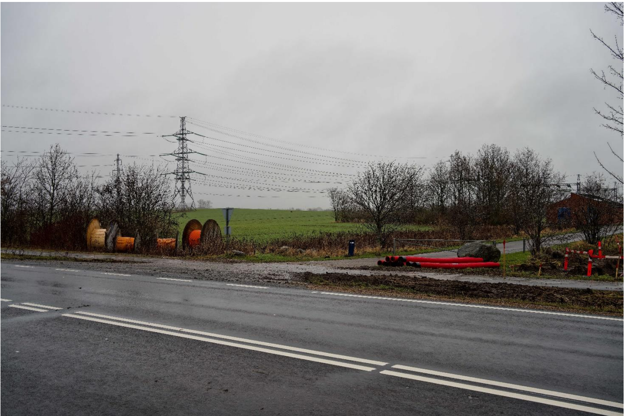
02 Fremtidige forhold set fra Lyngerupvej