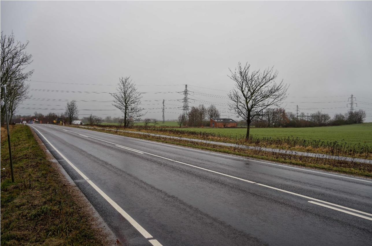
08 Fremtidige forhold set fra syd Lyngerupvej