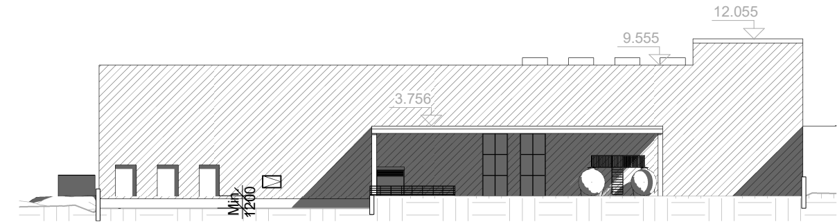
Facade Vest - Ny produktion 1 : 500