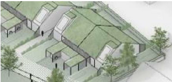
Figur 5 Princip illustration, som viser et hævet tagvindue.

Der må ikke etableres kviste. Dog må der etableres én kvist på boliger i 1½ etager og ét hævet vindue i tagfladen på boliger i 1 etage, som vist i princippet på figur 5.