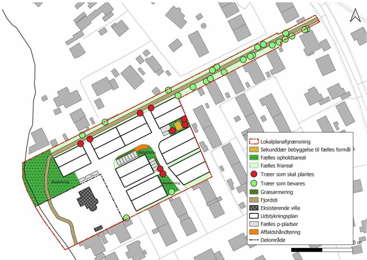
Kortbilag 4 viser Fællesarealer, beplantning og terrænregulering