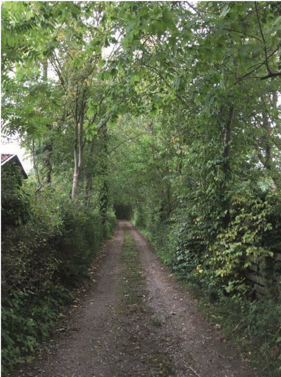
figur 3 - Eksisterende træallé