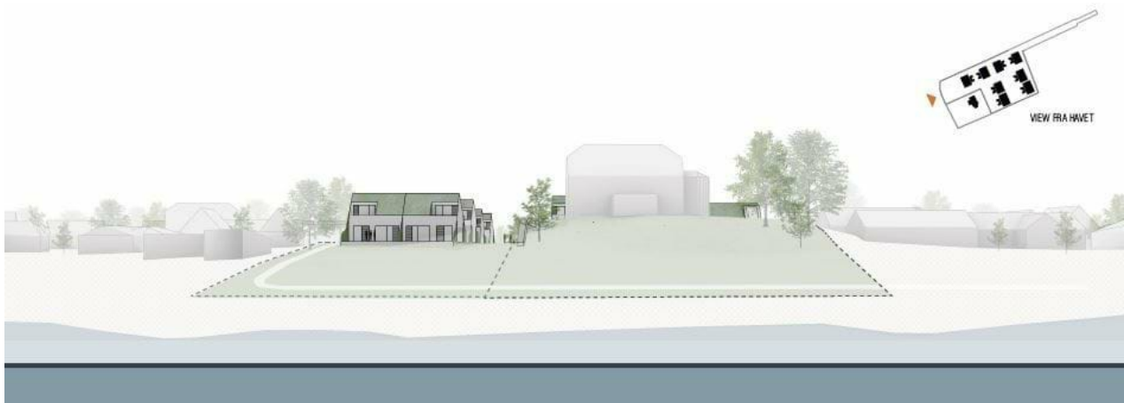
Figur 4 Illustration som viser den forventede bebyggelse samt den eksisterende bebyggelse set fra kysten.

Planen sikre, at bebyggelsen er tilbagetrukket som vist på figur 4.