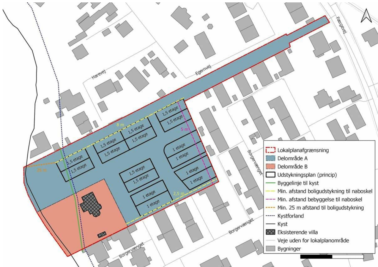
Kortbilag 2 viser delområder, byggelinjer og en principiel udstykningsplan.