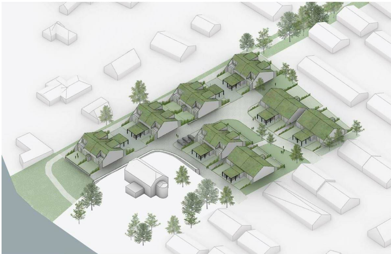
Figur 2 Visualisering af byggeri set fra sydvest i fugleperspektiv

Planen fastlægger orienteringen af boligerne, således at boligernes facader har samme længderetning som kysten. Ligeledes sikrer planen at boliger placeres med en afstand til nabobebyggelse på 2,5-8,0 meter.