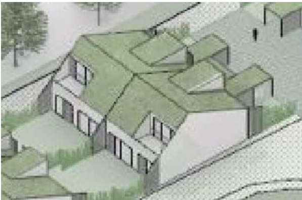
Figur 6 Princip illustration, som viser en indrykket altan med tagflade/gavlmur på 3 sider.

Indrykkede altaner skal være afgrænset af tagflade/gavlmur på mindst 3 sider og de skal ligge inden for bygningskroppen/facademuren, som vist i princippet på figur 6.