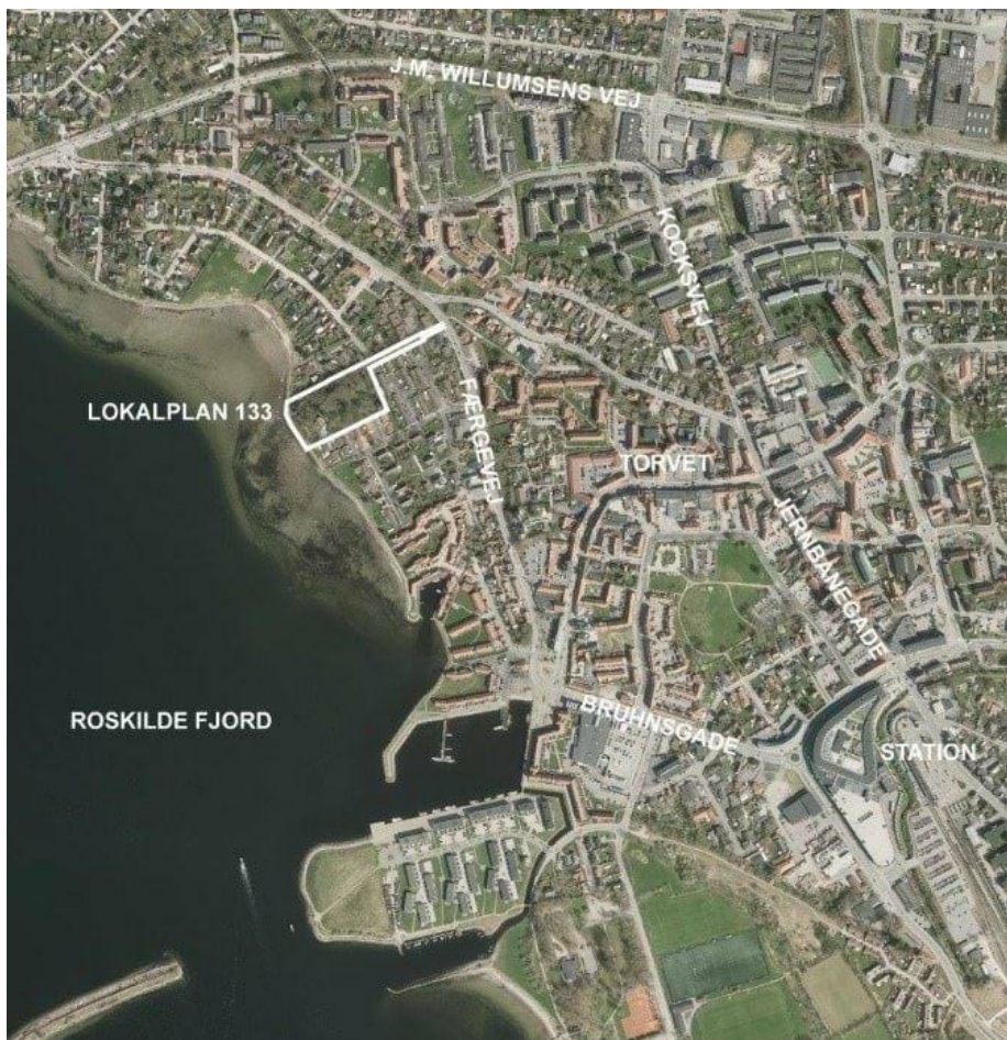
Figur 1 - Luftfoto med lokalplanafgrænsning