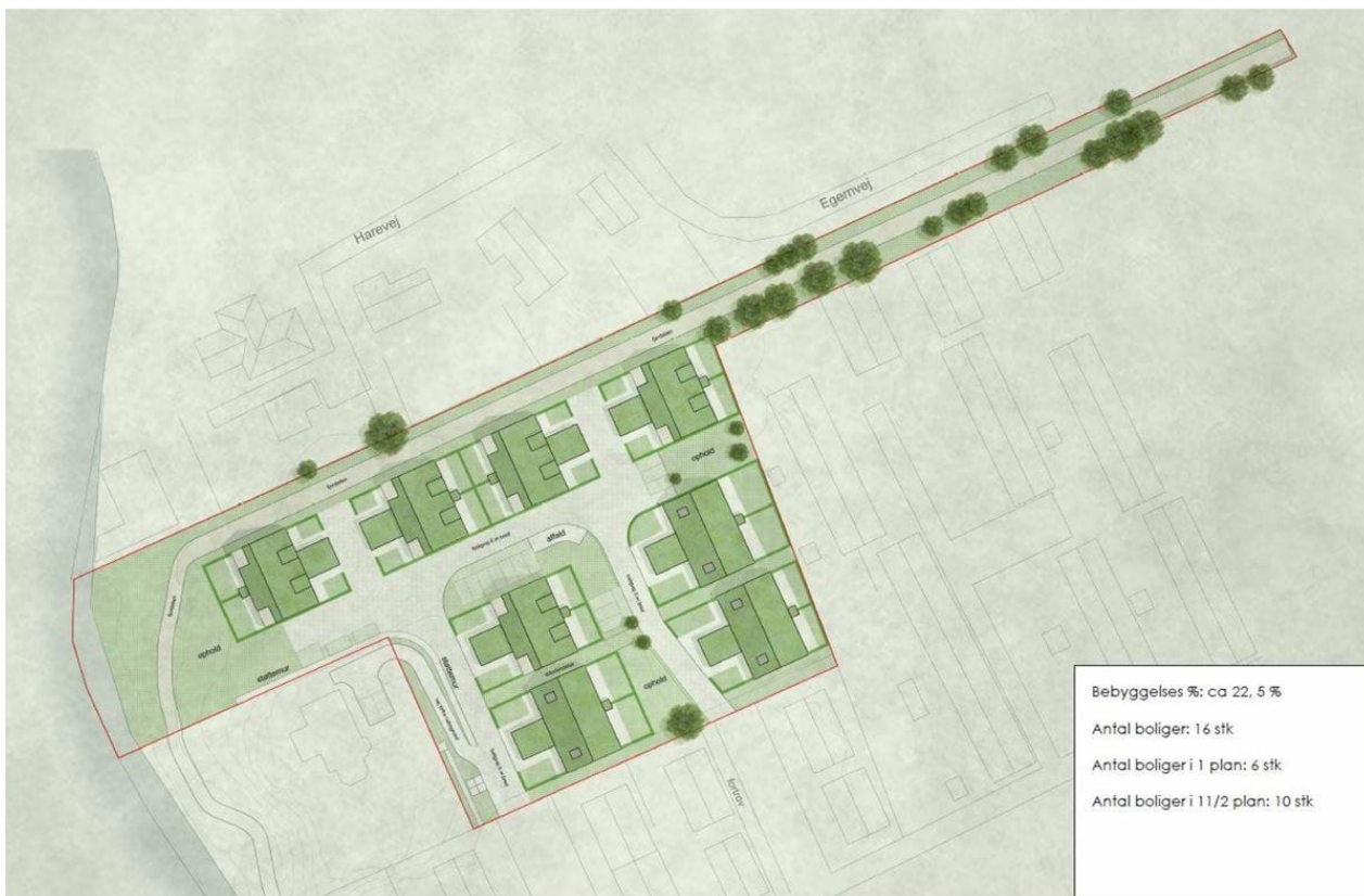
Kortbilag 5 viser en illustrationstegning af de planlagte arealer inden for lokalplanområdet.