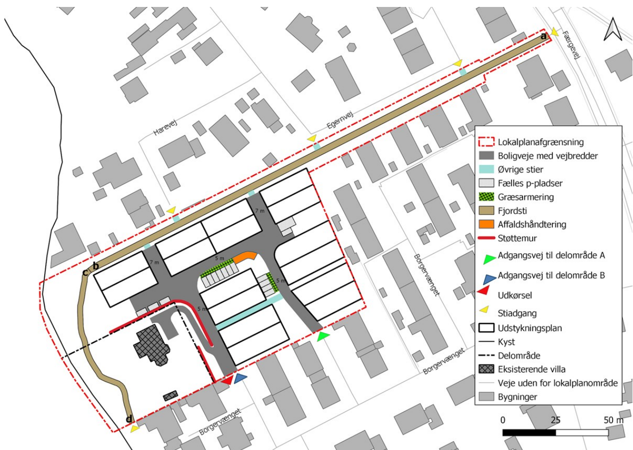
Kortbilag 3 viser veje, stier og parkering