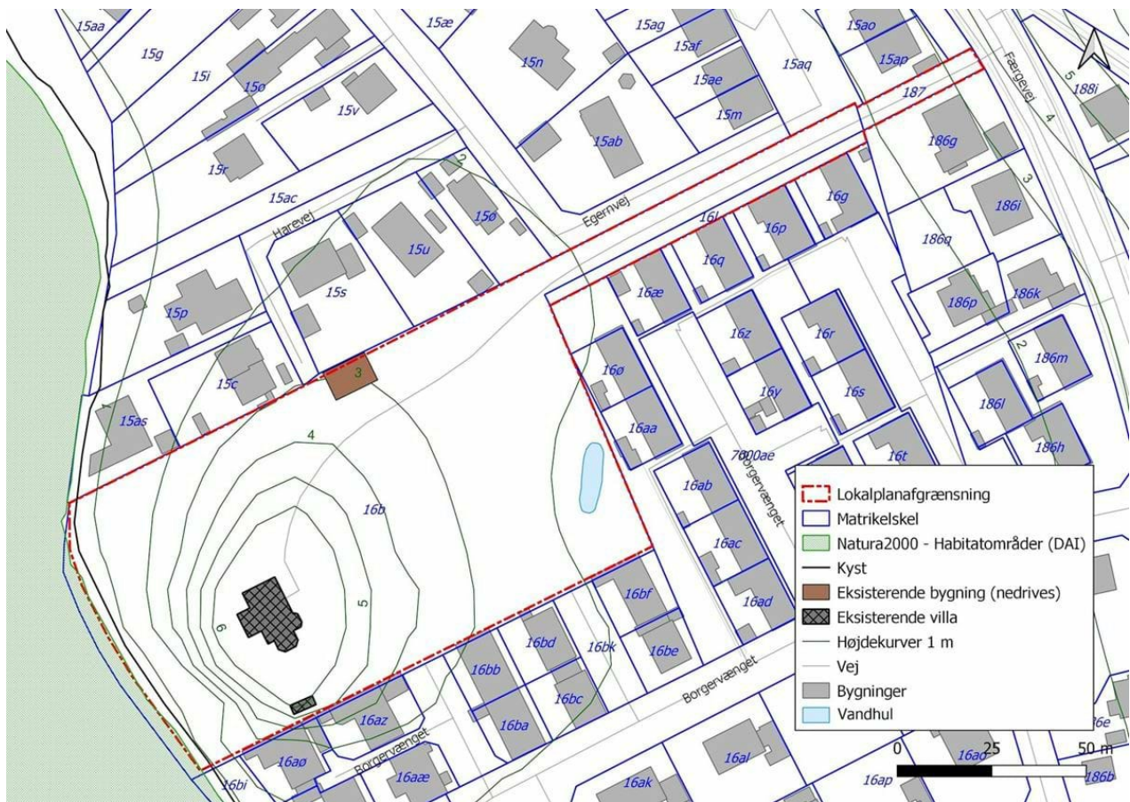
Kortbilag 1 viser lokalplanafgrænsning og eksisterende forhold. Eksisterende matrikelskel er baseret på unøjagtige digitale kort. Den nye lokalplanafgrænsning er baseret på og følger nye opmålinger af matrikelskel.