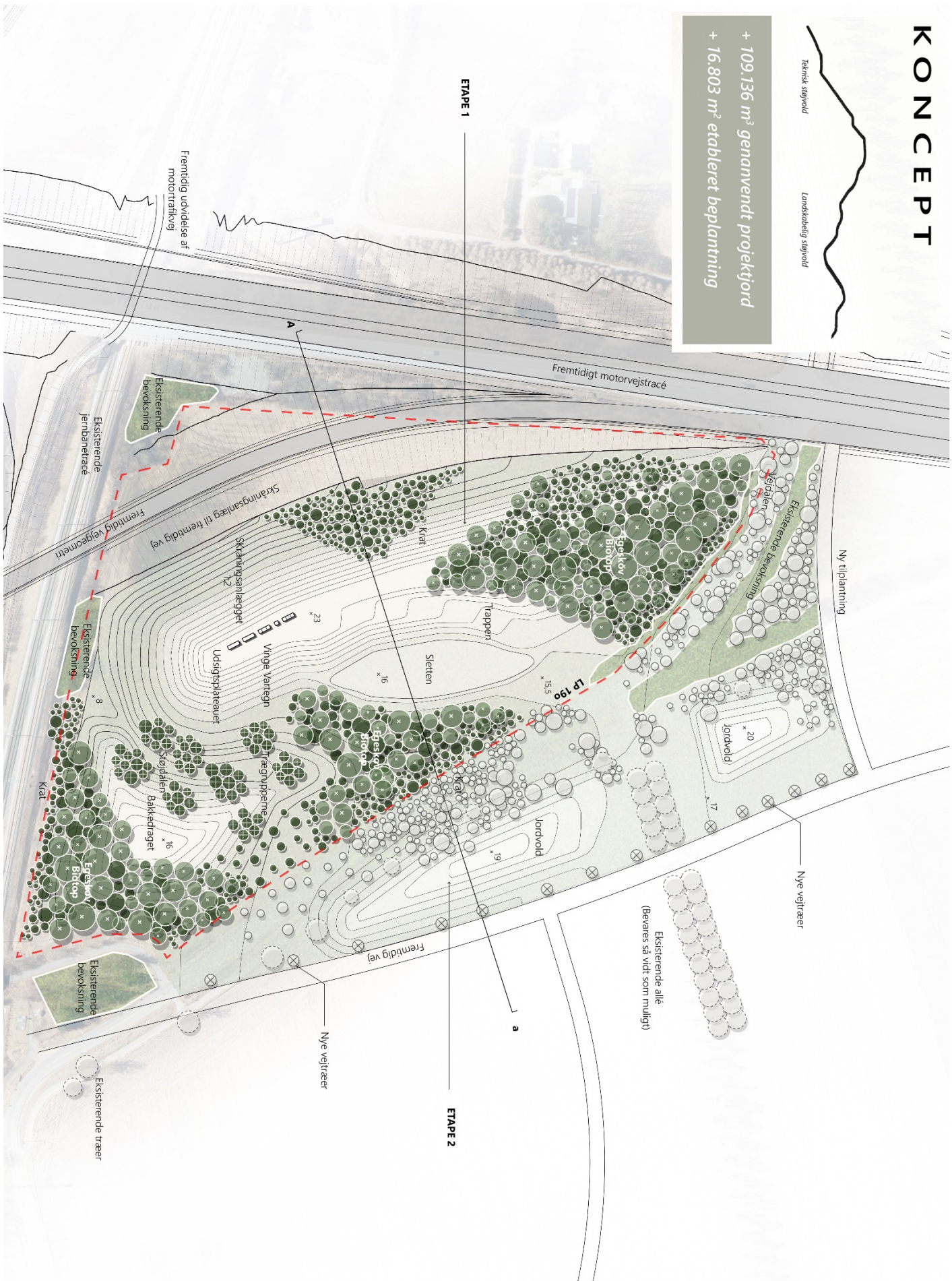
Plan (ikke målfast). Lokalplanområdet bliver en del af et sammenhængende støj- og skærmenende landskabsteknisk anlæg langs den kommende Frederikssundmotorvej.

+ 109.136 m 3 gennavnendt projektyord + 16.803 m 2 etableret beplantning