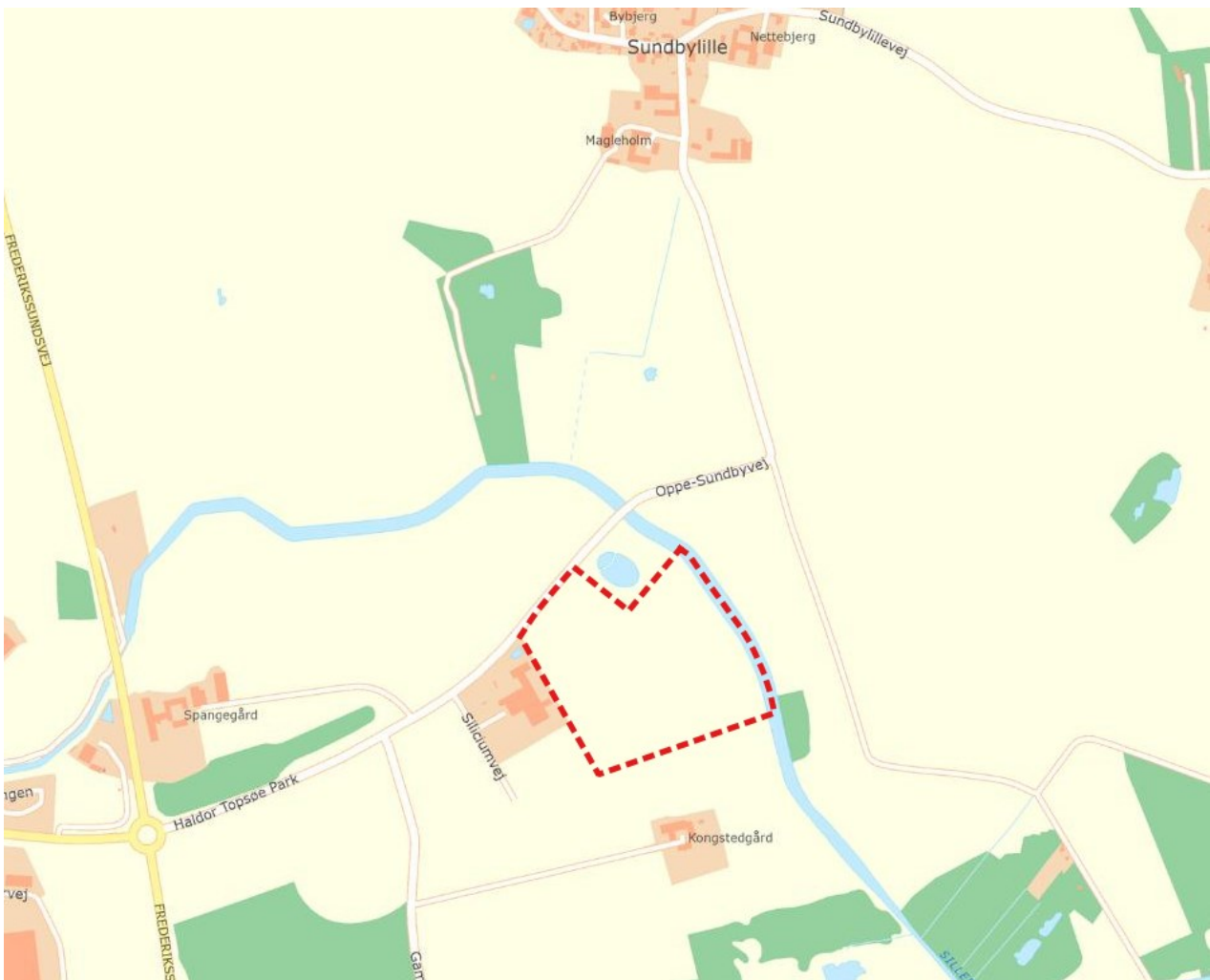
Lokalplanområdet med nære omgivelser