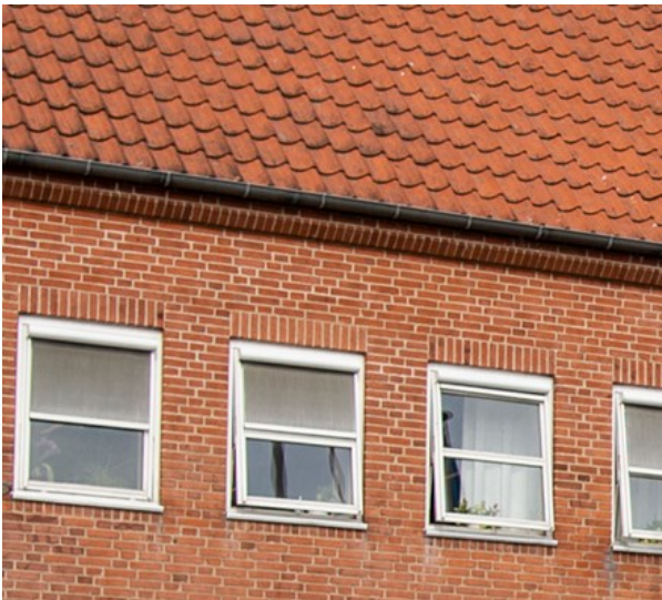
Eksempel på muret gesims

Facader skal have gennemgående muret gesims ved murkronen.