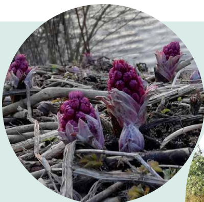
RØD HESTEHOVVED SØBRED -INVASIV ART