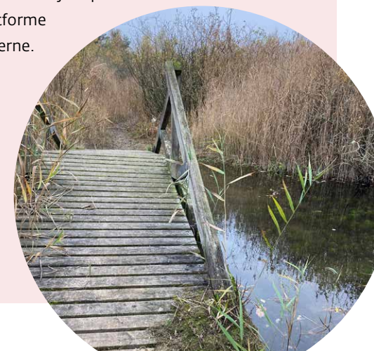
BRO I GRUSGRAV SØ VED KILDESKÅRET

De kortlagte stisystemer indarbejdes på kommunens digitale platforme som information til borgerne.