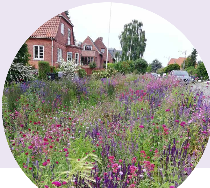
AFVANDINGSBED FRA VEJE MED BLOMSTER TIL INSEKTER OG SMÅDYR

Større biodiversitet kan også opnås ved at så og plante forskelligt vegetation til glæde for insekter og dyr efter retablering af gravearbejde i græsrabatter.