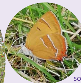
SOMMERFUGL I GRÆSPLÆNE