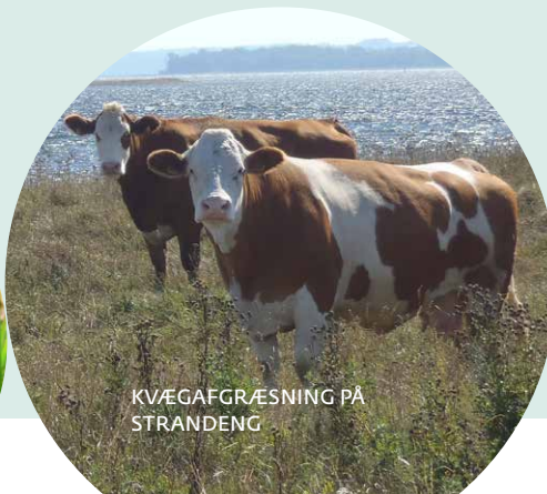
KVÆGAFGRÆSNING PÅ STRANDENG