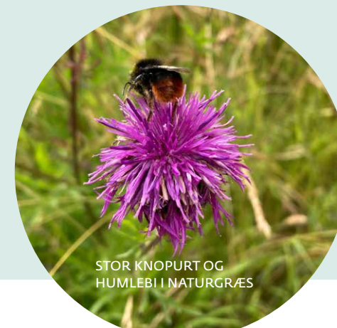
STOR KNOPURT OG HUMLEBI I NATURGRÆS

Udarbejdelse af plejeplaner sker med inddragelse af interessenter fx via Grønt Forum.