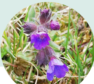
HIMMEBLÅ LUNGEURT PÅ KALKOVERDREV

Statens støtteordning indeholder bl.a. rydning af krat og forberedelse til kvægafgræsning. Kvægafgræsning kan give en robust naturpleje med høj naturkvalitet. Afgræsning giver lys til de små arter ved selve græsningen, de tunge dyr skaber barjord som mikrohabitater, hvor sjældne frø kan spire og kokasserne giver levested for sjældne arter af biller.