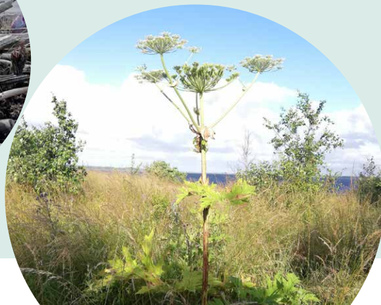
KÆMPEBJØRNEKLO I TILGROET AREAL -INVASIV ART

Ved bekæmpelse af invasive arter prioriteres arter med konkrete trusler mod værdifulde naturarealer og arter, som kommunen er forpligtet til at håndtere eller hvor de udgør problemer for arealets anvendelse.