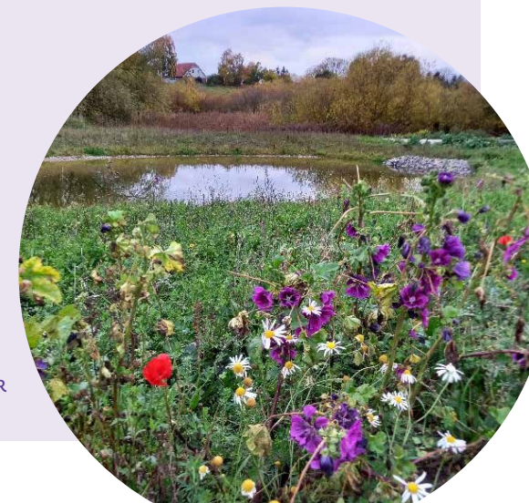
BYNÆRT REGNVANDS-BASSIN MED BLOMSTER TIL INSEKTER

Når vi skal skabe gode betingelser for biodiversiteten er variation helt centralt, både i arter og levesteder. Der skal skabes mad, skygge, skjul og muligheder for at overvintre. Derfor er der behov for både blomster og træer, og for både levende og dødt plantemateriale.