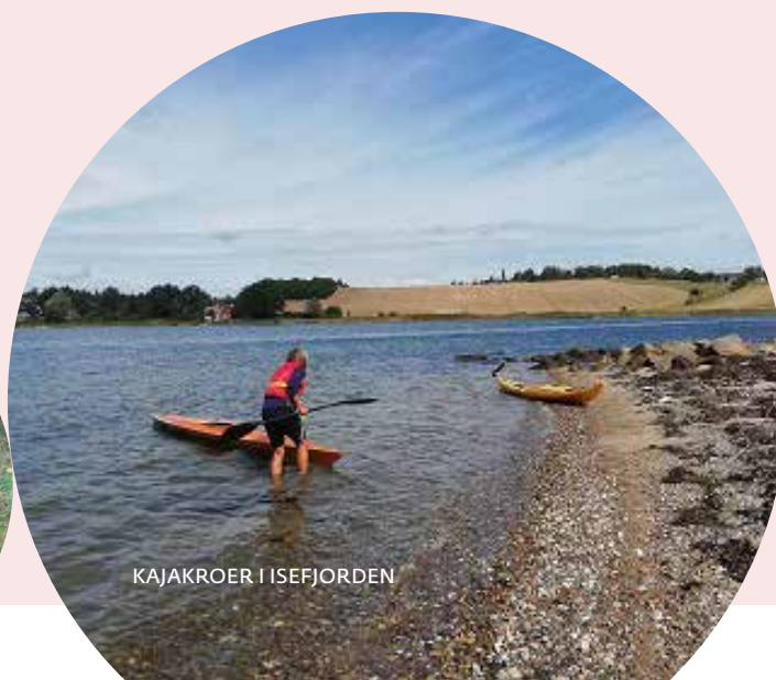
KAJAKROER I ISEFJORDEN