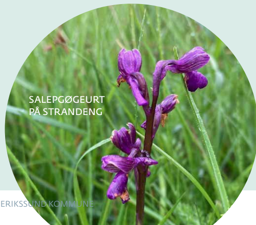
SALEPGØGEURT PÅ STRANDENG

Du kan se hvilken naturkvalitet dit område har på Danmarks arealinformation på Miljøportalen