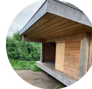
SHELTER FOR GANGBESVÆREDE