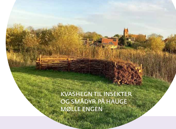
KVASHEGN TIL INSEKTER OG SMÅDYR PÅ HAUGE MØLLE ENGEN