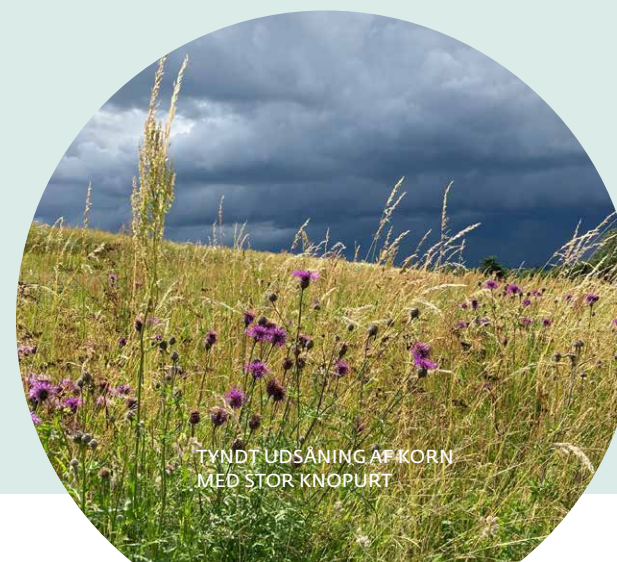
TYNDT UDSÅNING AF KORN MED STOR KNOPURT

Derudover kan der søges nationale puljer til støtte der tilgodeser natur i vildtplejen m.fl. samt støtte til græsning i fredskov.