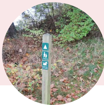
SKILT VED SKULDELEV ÅS FREDNING

Nationalpark Skjoldungernes land ønsker i samarbejde med Frederikssund Kommune og andre aktører, at etablere flere faciliteter omkring fuglereservatet Selsø Sø, så de besøgende får mest muligt ud af deres besøg, men også koncentrerer på bæredygtige poster, der kan håndtere de besøgende uden at give forstyrrelser i naturen.