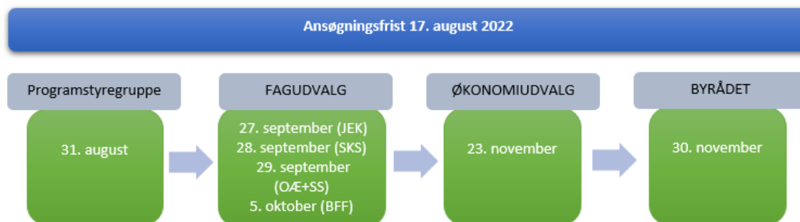
Figur 2 viser proces for behandling af ansøgninger med ansøgningsfrist d. 17. august 2022