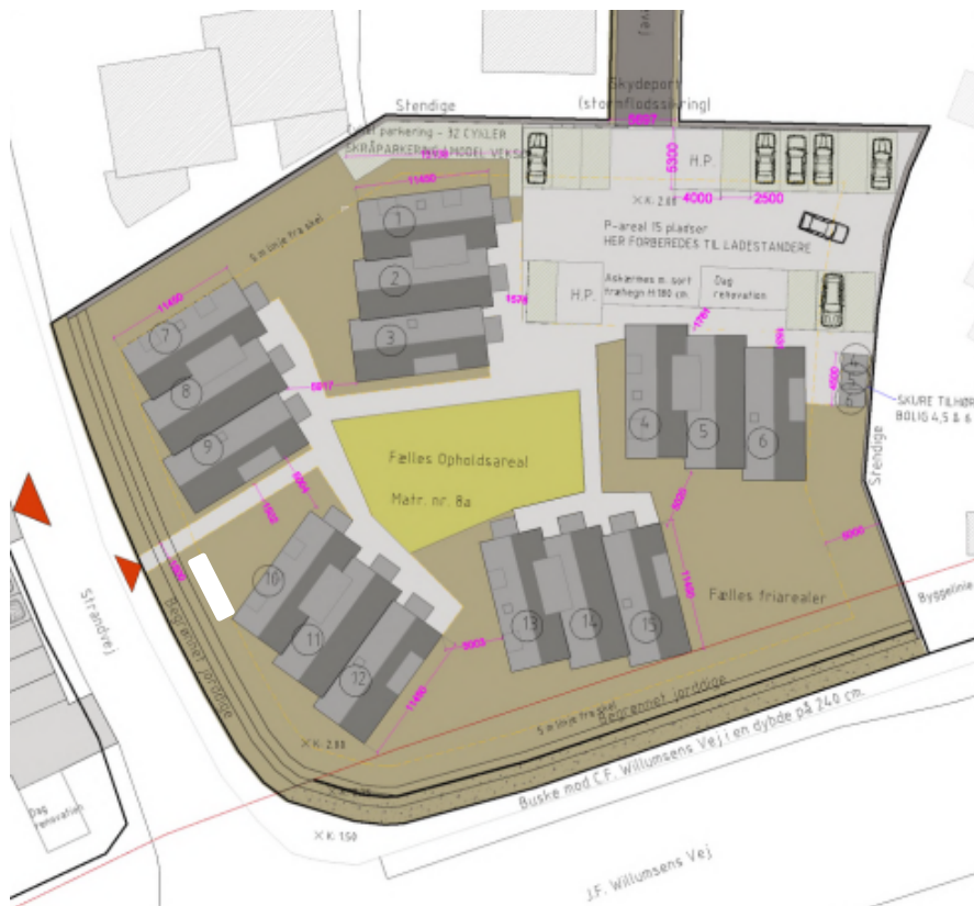
Figur 1: Oversigt over kystbeskyttelses anlægget.

Projektet har til formål at beskytte projektområdet mod oversvømmelser i forbindelse med stormflod.