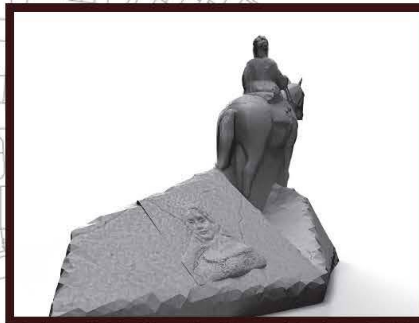
3D visualisering af den første model til Grevinder Danner til hest