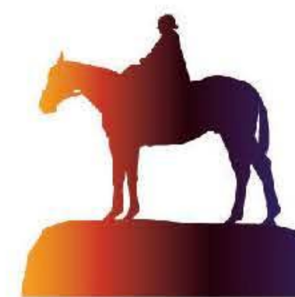
Grevinde Danners Rytterstatue

De forskellige elementer i denne skulpturelle installation kan stimulere med berøring og syn, beskueren kan omgives af skulpturen eller betragte den udefra.