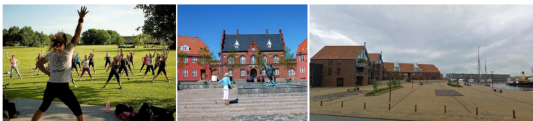
Aktivitet på Bløden, Rådhuset i Frederikssund og havnepladsen.

Opgaven med ensomhed skal også løses i samarbejde med kulturaktører, børne-, unge- og ældreinstitutioner og -foreninger – og kan i høj grad hjælpes på vej af nye fysiske rammer.