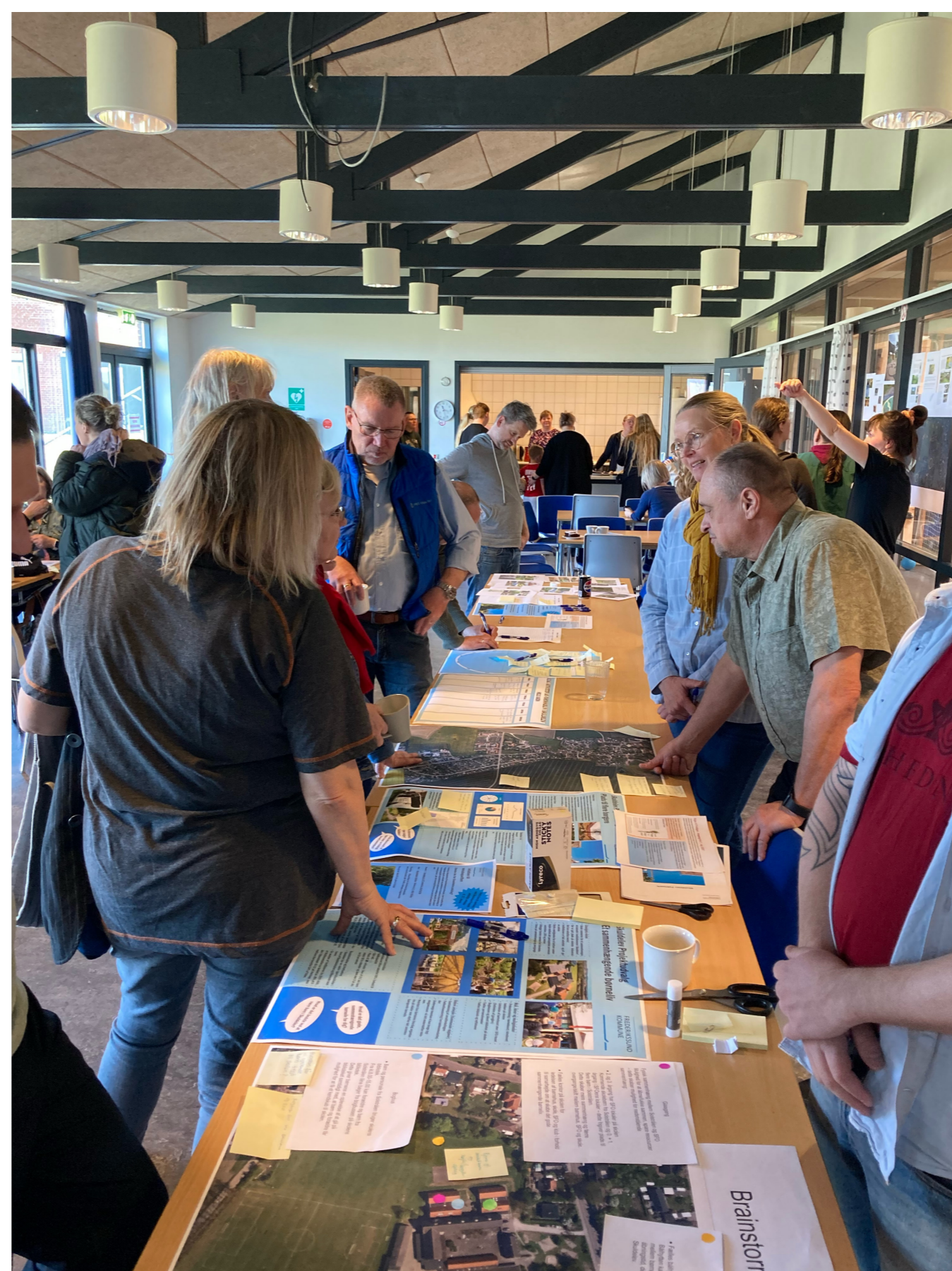
^ Der var stort tilløb til Udvalgets bod ved det populære Åbent Hal Arrangement i Skuldelev Hallen.

^ I en aktiv by som Skuldelev er der flere aktiviteter næsten alle dage i løbet af ugen.