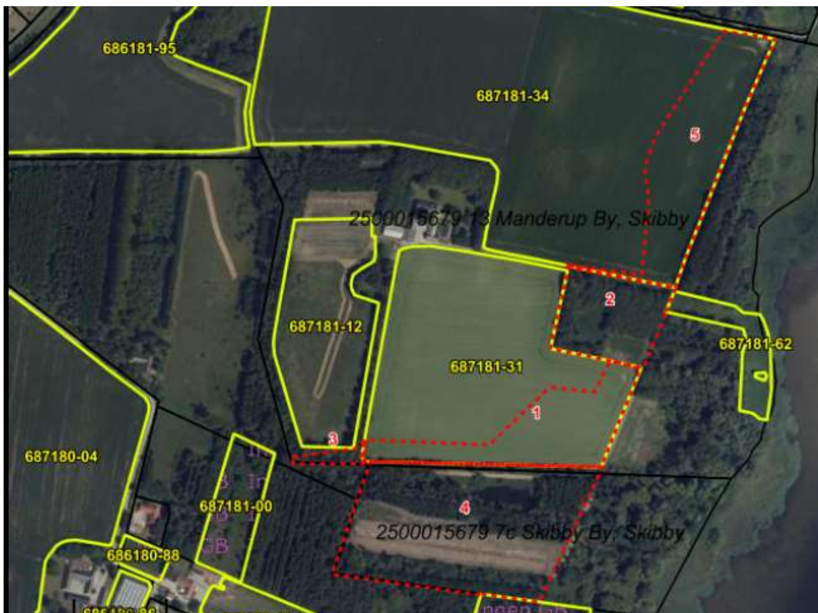
Figur 2. Arealer der skal udtages af udpegningerne til Grønt Danmarkskort på ejendommen Marbækvej 7, 4050 Skibby

I forhold til valideringen af udpegningerne på min ejendom, så skal jeg hermed bede Frederikssund Byråd om at udtage de 5 områder der fremgår af figur 2 af udpegninger til Grønt Danmarkskort.