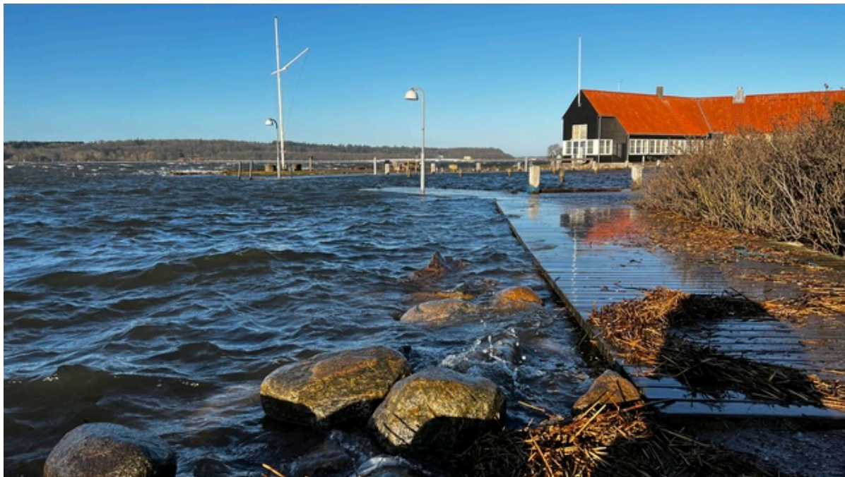
Skillebakke Havn.

Frederikssund Kommunes fotograf har været en tur rundt i kommune her til morgen. Her kan du se nogle af billederne fra Kulhuse, Over Dråby Strand og Skillebakke Havn.