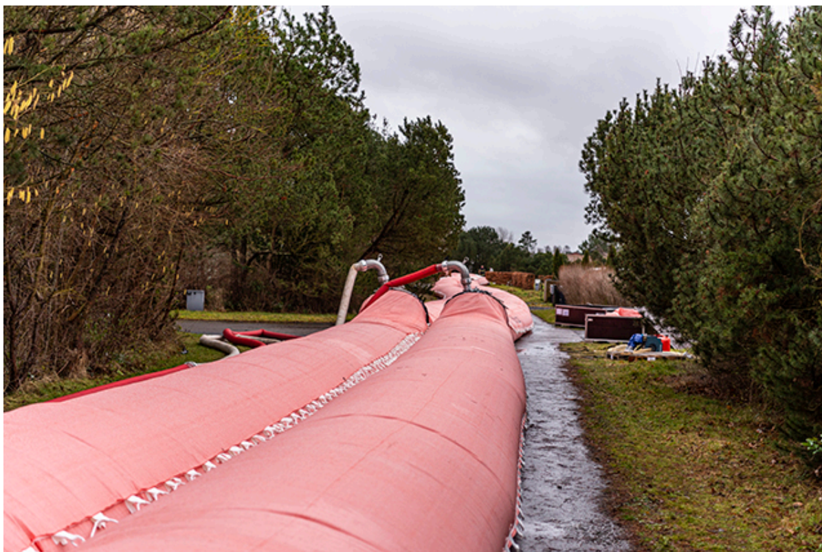
Watertubes i Hyllingeriis, der fyldes af Beredskabsstyrelsens enorme pumper.

Beredskabet og kommunens krisestab har arbejdet i døgndrift siden fredag morgen for at sikre så gode forberedelser som muligt til stormen og højvandet. Vandstanden ventes at toppe søndag ml. kl. 9 og 15, og beredskabet vil kontinuerligt være på højeste niveau indtil faren er drevet over.