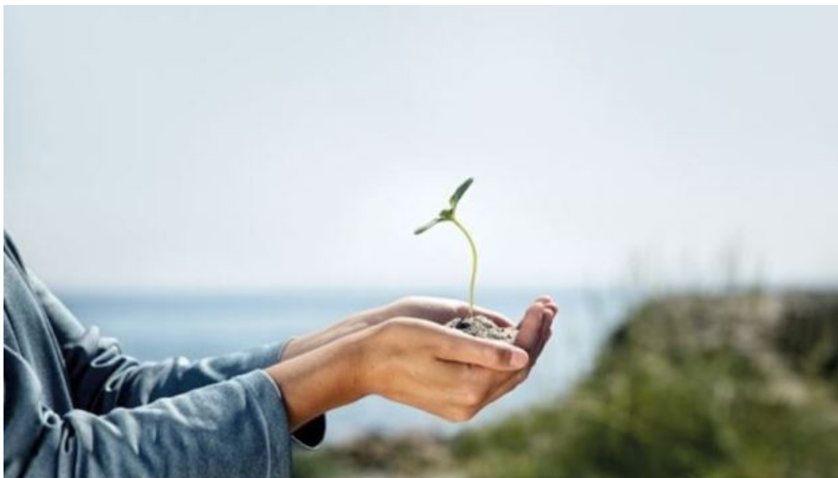
Hænder holder grøn plante.