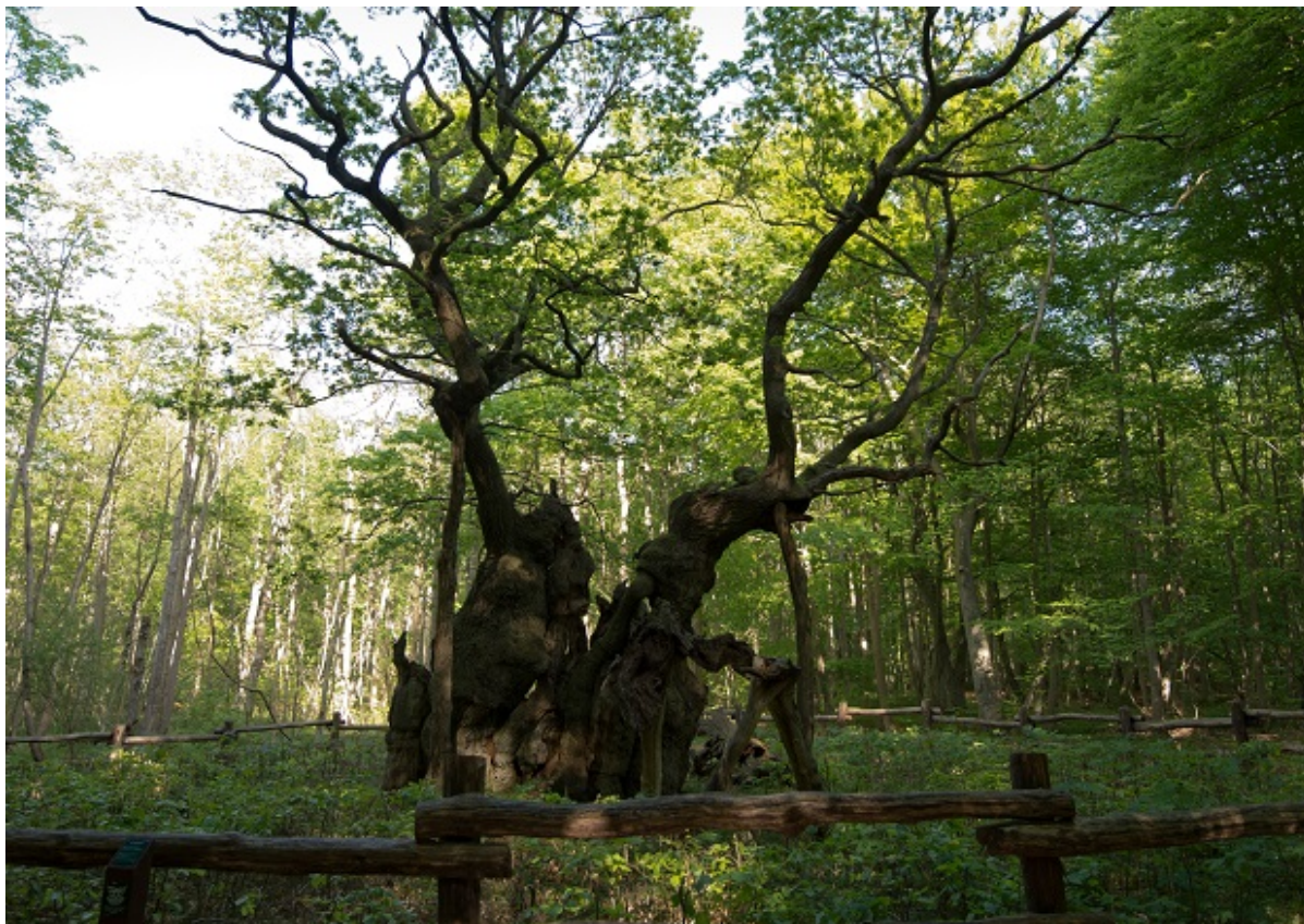
Kongegegen i Jægerspris.

Onsdag den 8. juni åbner et nyt værested for unge i Jægerspris. Værestedet ligger på Parkvej og vil tilbyde unge i alderen 16 til 30 år med udfordringer i livet et trygt sted at komme og mødes med ligesindede.