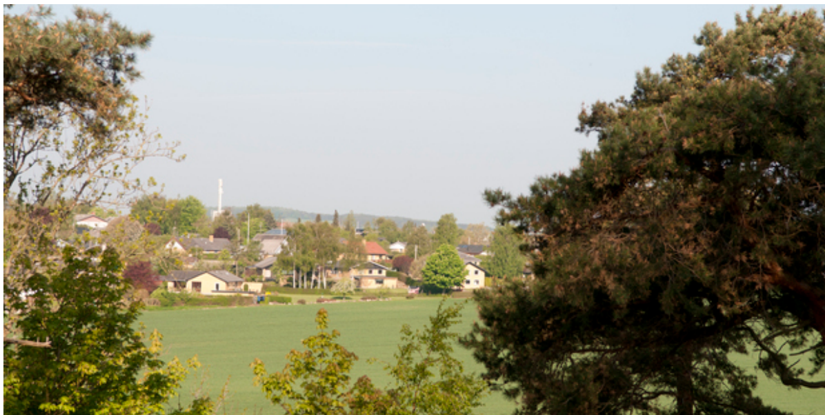
Udsnit af Skuldelev.

Arbejdet er i gang for at oprettes en ny lokal aktionsgruppe (LAG) i Lejre og Frederikssund Kommuner. Den nye LAG forventes at uddele støtte på ca. 12,5 mio. kr. i perioden 2023-27. Nu indkaldes der til stiftende generalforsamling og webinar om LAG-arbejdet.