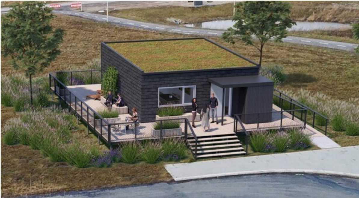
Visualisering af Klimakassen ved Vinge Station. Visualisering: P+P Arkitekter.