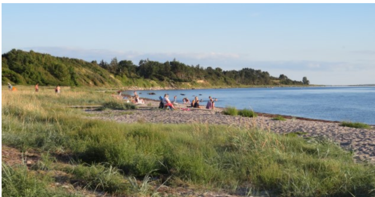
Kulhuse Strand.

I Kulhuse og Marbæk møder du det Blå Flag, der blandt andet signalerer god badevandskvalitet. Hen over sommeren kan du komme til flere arrangementer på disse strande, som sætter fokus på natur, miljøbevidsthed og bæredygtighed.