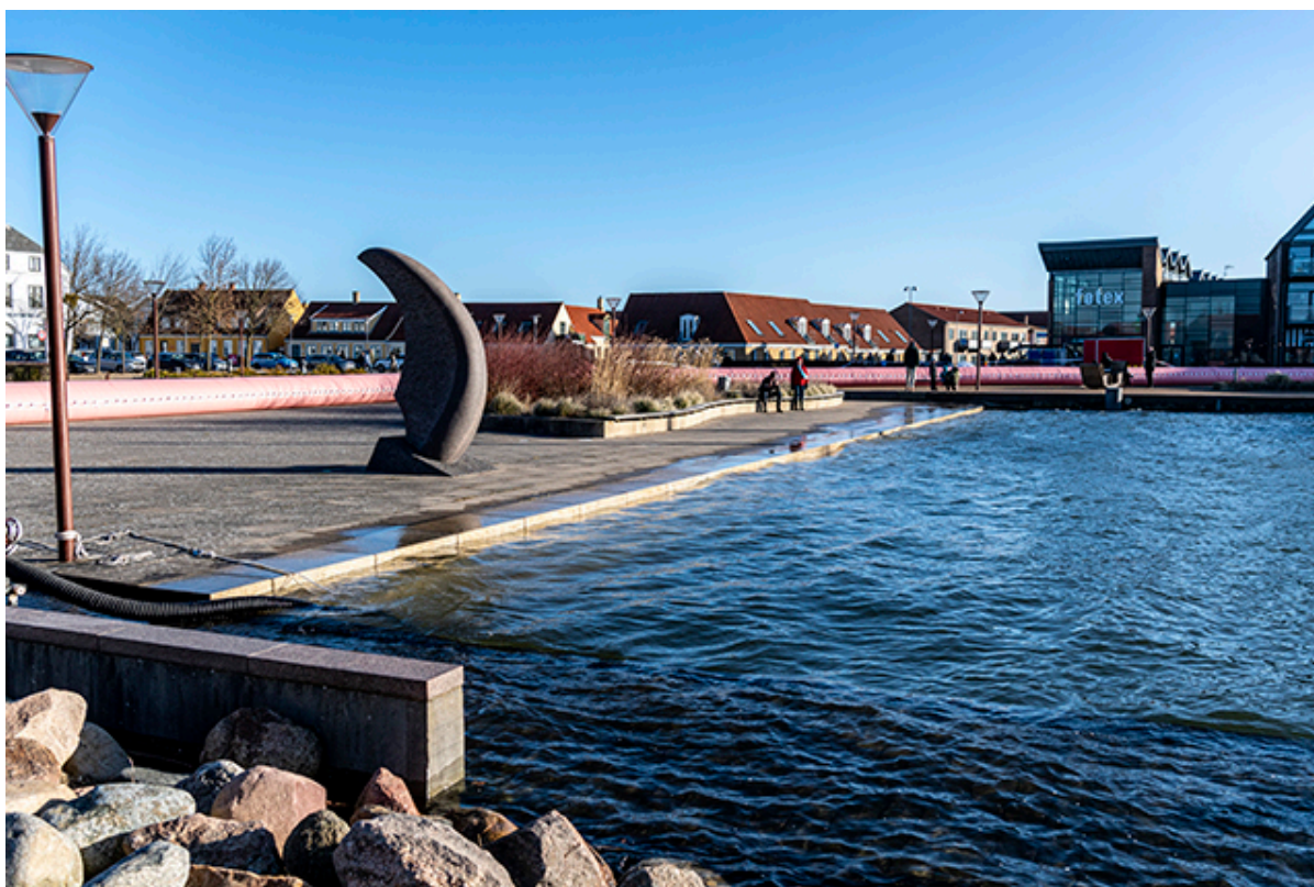
Frederikssund Havn med højvande og watertubes på havnefronten.

Et omfattende projekt, der skal klimasikre bymidten i Frederikssund, begynder den 21. juni på Bløden med picnic og en tur rundt i byen og fortsætter i løbet af sommeren med spørgeskemaer og workshops. Projektet skal indsamle masser af input fra borgerne, og målet er at få alle ideer frem, der kan skabe synergi mellem kystbeskyttelsen og bylivet.