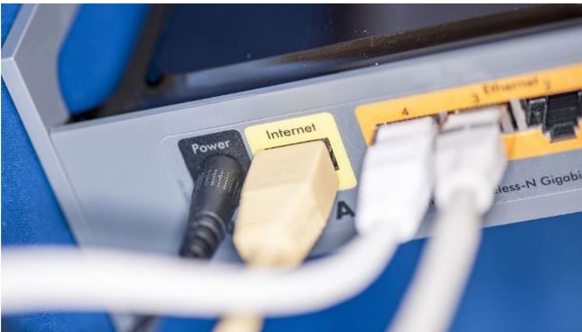
Netværkskabel tilsluttet pc.

Nu åbner Bredbåndspuljen for ansøgninger i 2022. Som noget nyt er der i år mulighed for, at særligt enkeltstående adresser kan søge uden at skulle slå sig sammen med andre.